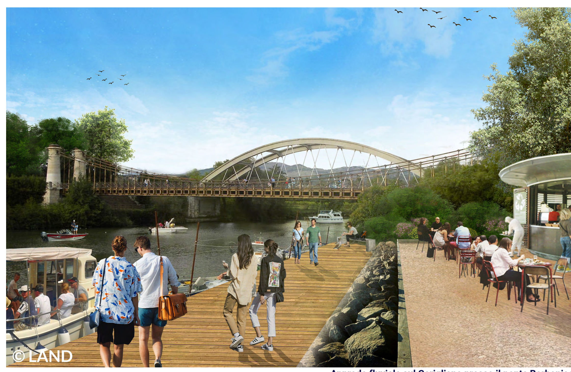
Approdo fluviale sul Garigliano presso il ponte Borbonico