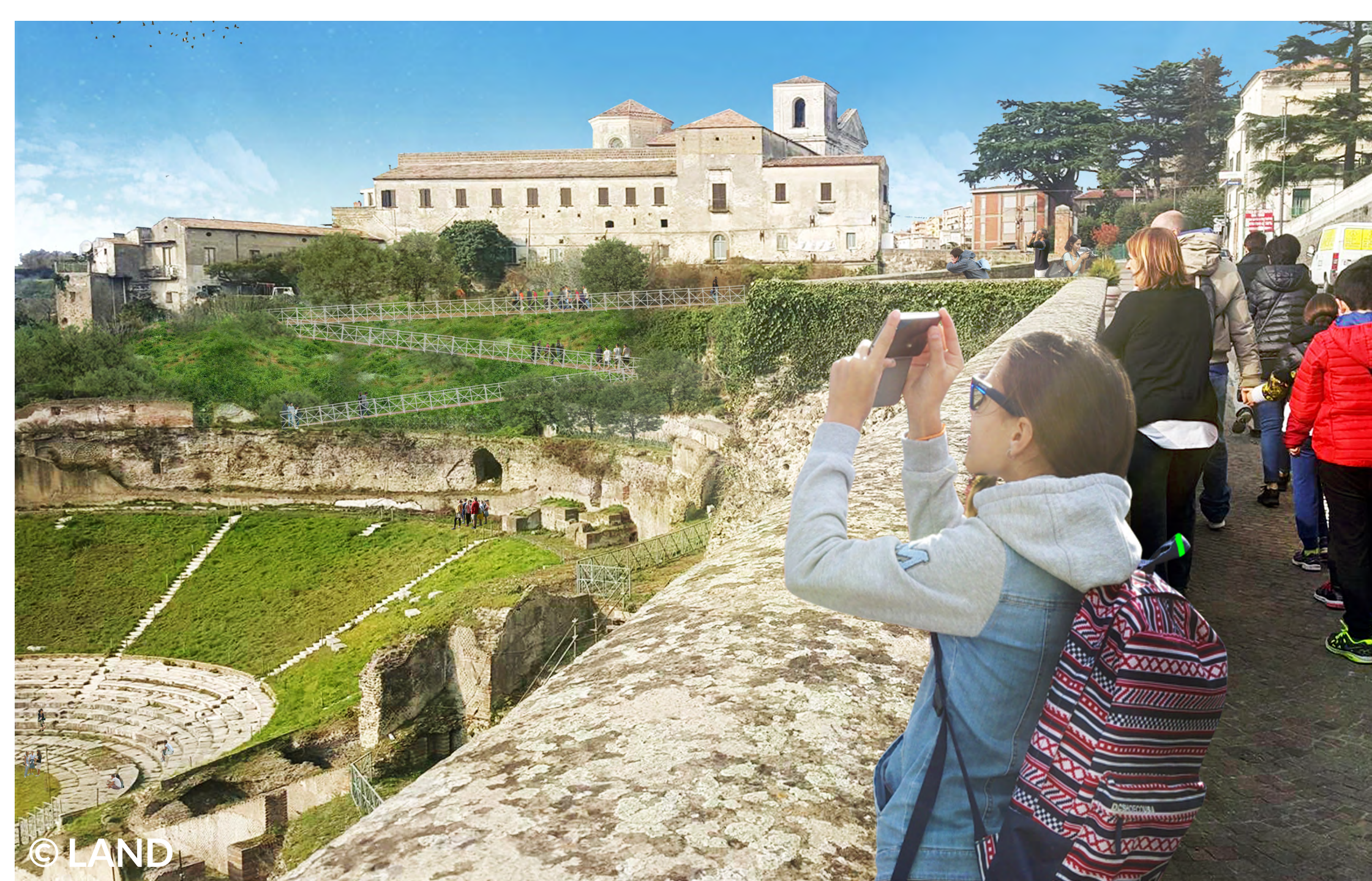
Teatro Romano di Sessa