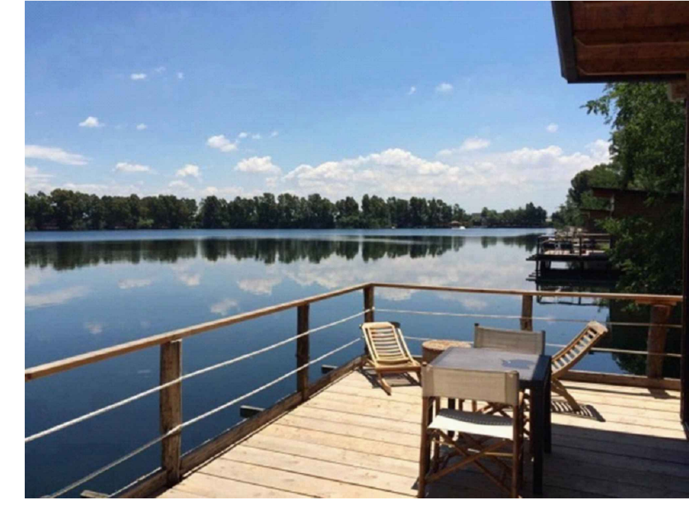
LAGHETTI DI CASTEL VOLTURNO VISTI DAL PLANA RESORT