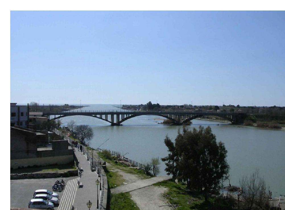
IL VOLTURNO NEI PRESSI DELLA FOCE