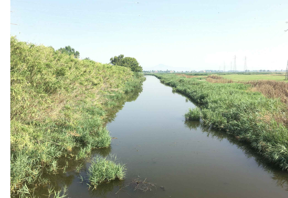
CANALE VENA (TRA I REGI LAGNI E LAGO PATRIA)