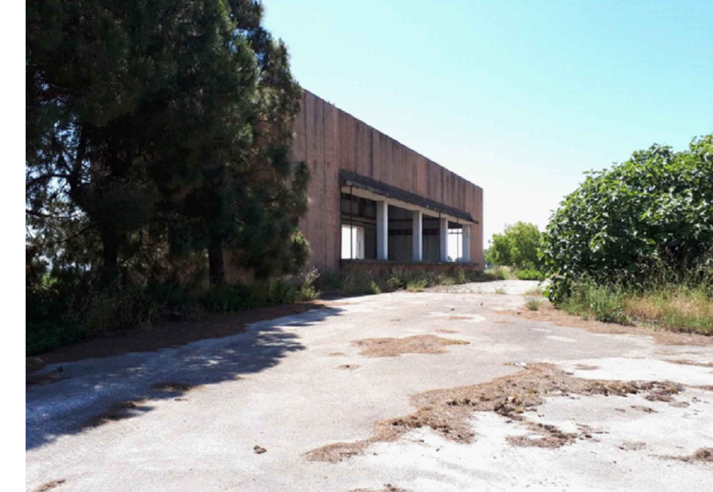
IDROVORA SAN SOSSIO A CASTEL VOLTURNO (ABBANDONATA)